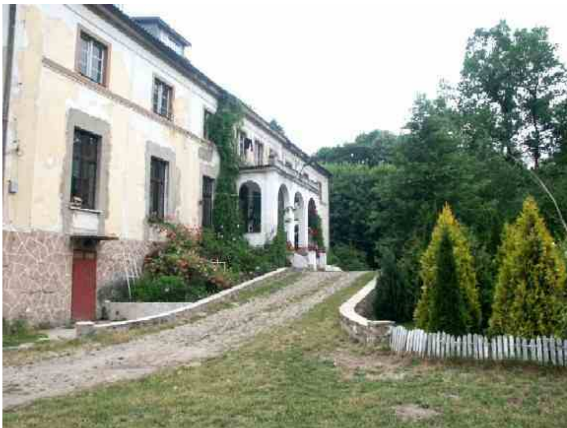
Dwór późno klasycystyczny z podjazdem, murowany, piętrowy ozdobiony gankiem zwieńczonym balkonem, z połowy XIX wieku.

We wsi zachował się cmentarz ewangelicki, oraz prawdopodobnie z połowy XIX wieku elementy nagrobne. We wsi zachowały się stare domy i zabudowania gospodarcze, np. spichlerz murowany z 1865 roku dom i stodoła nr 31 szachulcowo-murowane, z drugiej połowy XIX w. Są tam również stare zagrody bliźniacze ze stodołami bramnymi od ulicy i chałupami dwojakimi w głębi.