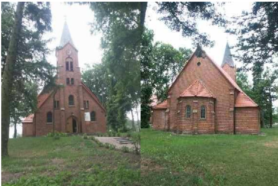
Kościół filialny p.w. Najświętszego Serca Pana Jezusa, neogotycki z 1913/14 roku.

Dodatkowym atutem są znajdujące się tutaj park przy dawnym dworze rodziny Bandamerów- rodu dawnych właścicieli Gąbina oraz m.in. zabudowania gospodarskie z XIX wieku- murowany spichlerz, czy też stodoła szachulcowo- murowana .