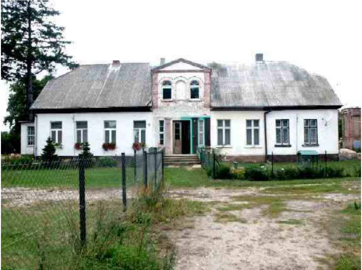
Dwór nr 15 , murowany, zbudowany w I połowie XIX wieku. Obiekt parterowy, późnoklasycystyczny. Obok park ze starodrzewiem i dębową aleją.